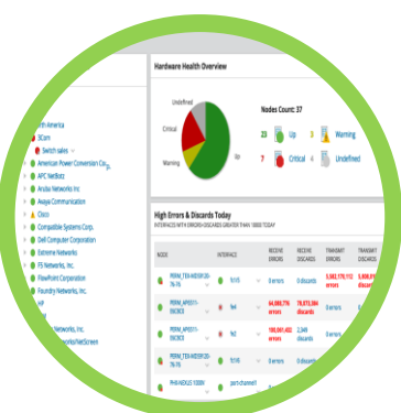
Monitoreo de dispositivos

El reporte del análisis contendrá los siguientes servicios: